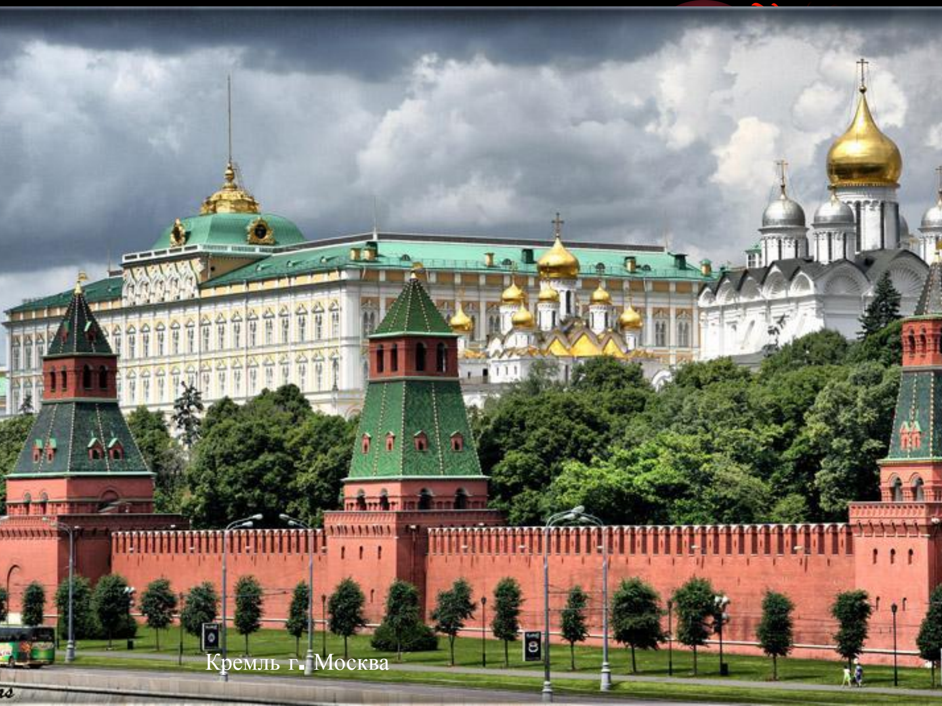
Кремль г. Москва