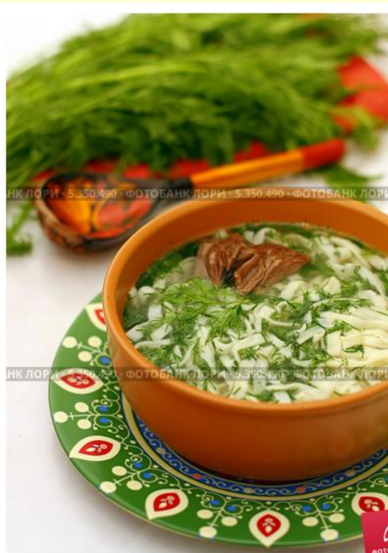
Токмач по-татарски или суп-лапша домашняя