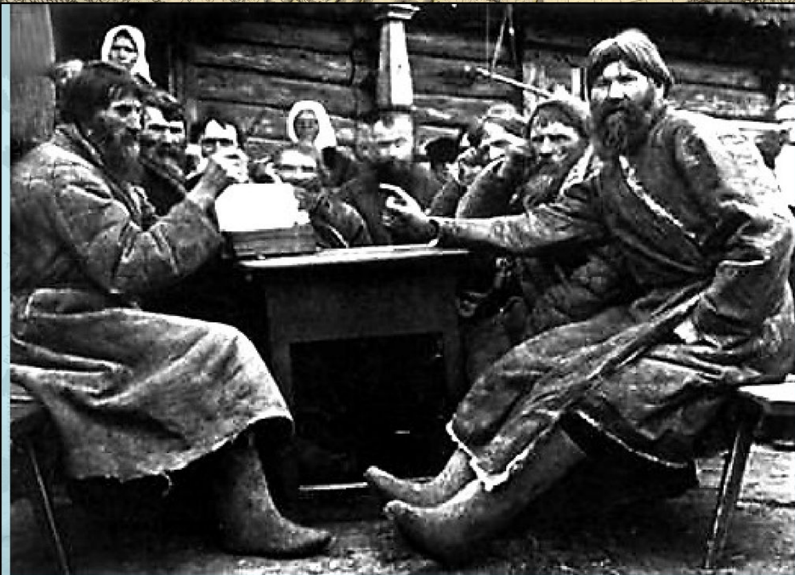
Сходка крестьянской общины во 2-ой половине XIX века.

Был ли решен крестьянский вопрос реформой 1861 года?