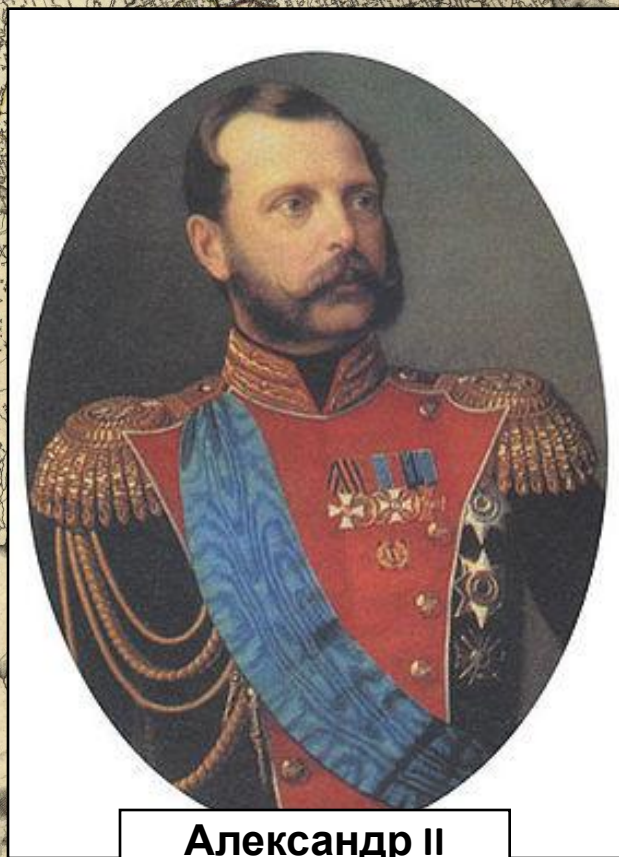
Александр II Освободитель