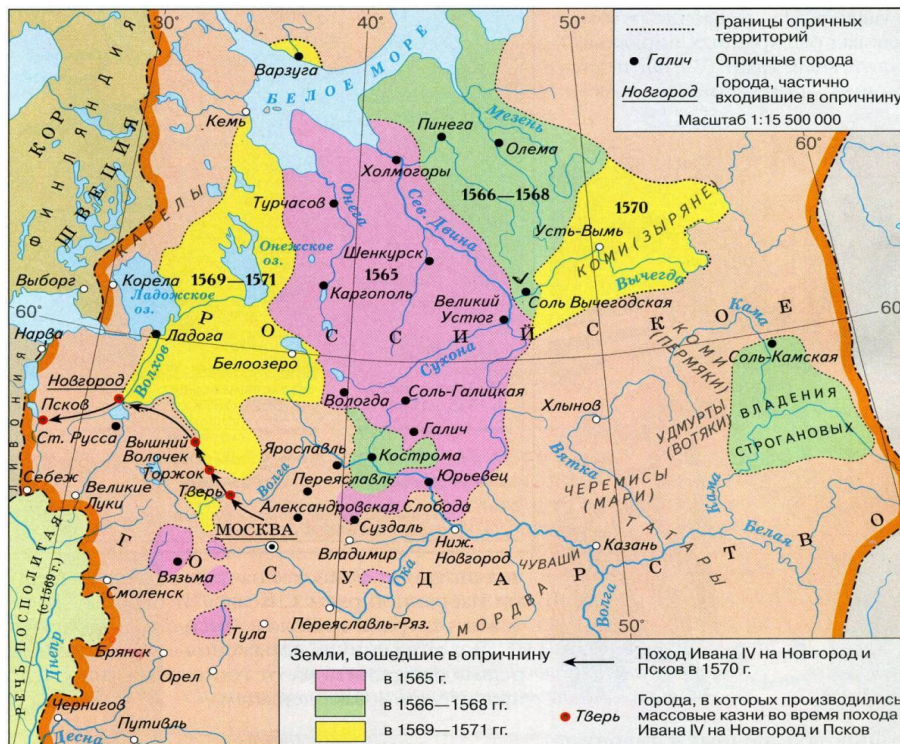
Карта с направлениями походов Ивана Грозного на Новгород и Псков