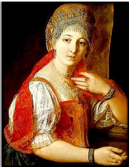
Елена Васильевна Глинская