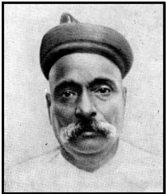
Лидером «крайних» стал Балгангадхар Тилак (1856—1920), видный учёный- историк.