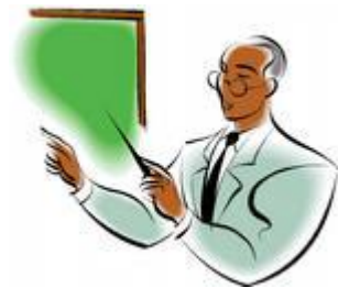
СХЕМА ЛИЧНОГО ПРОФЕССИОНАЛЬНОГО ПЛАНА