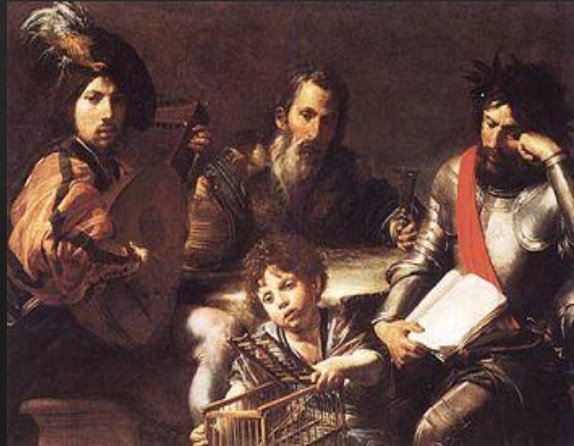
Валантен де Булонь. Четыре возраста мужчины. 1626 г.