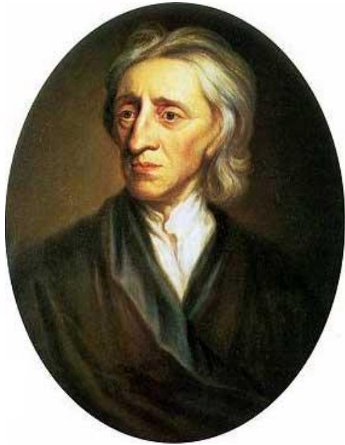
Дж. Локк (1632-1704)

Часто в качестве метафоры для обозначения процесса развития используют понятие «эпигенетический ландшафт», предложенное эволюционным биологом К. Уоддингтоном (1957)