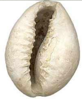
Раковина Каури

Товарные (вещественные, натуральные) деньги — деньги, в роли которых выступает товар, обладающий самостоятельной стоимостью и полезностью.