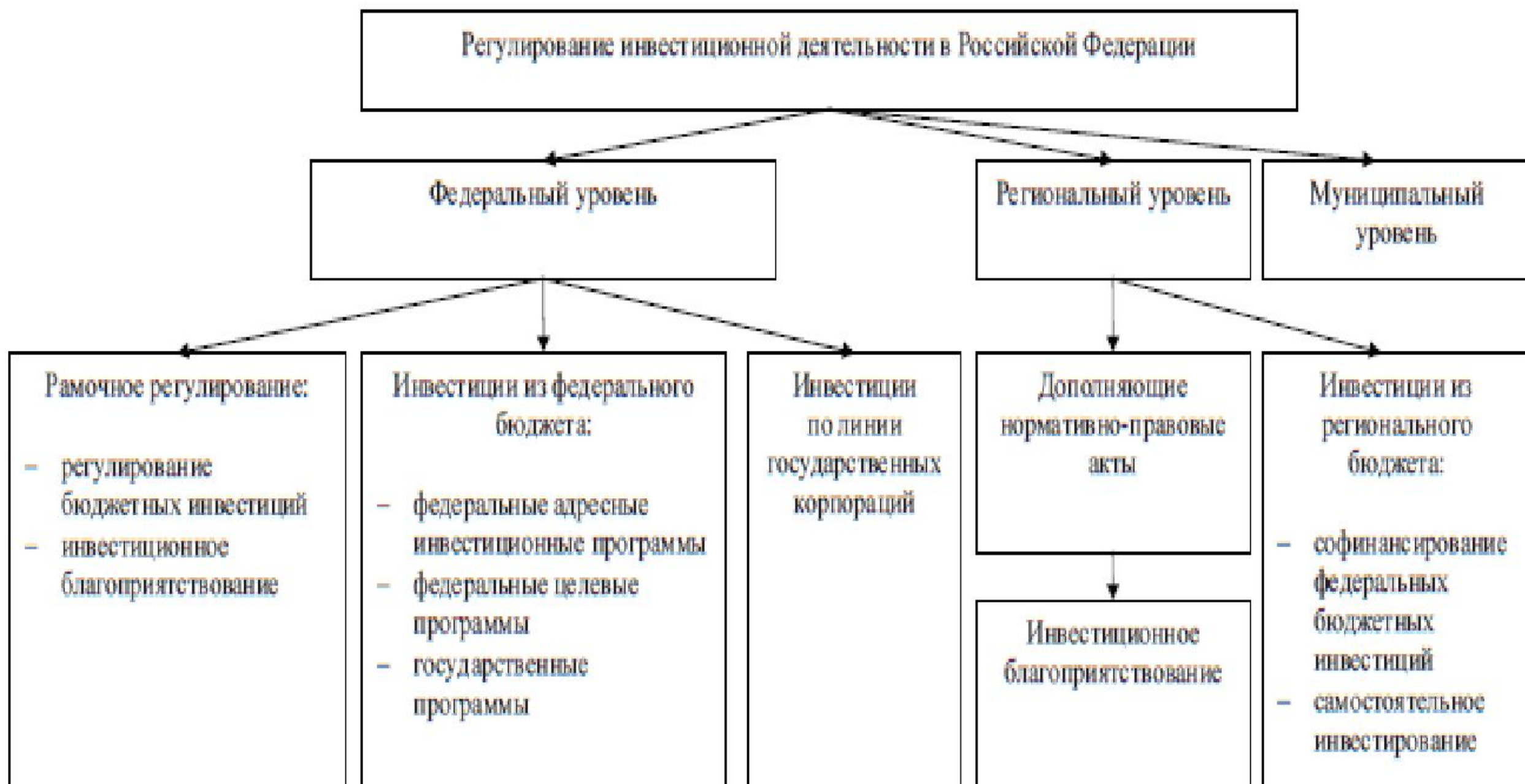
Схема регулирования инвестиционной деятельности в Российской Федерации