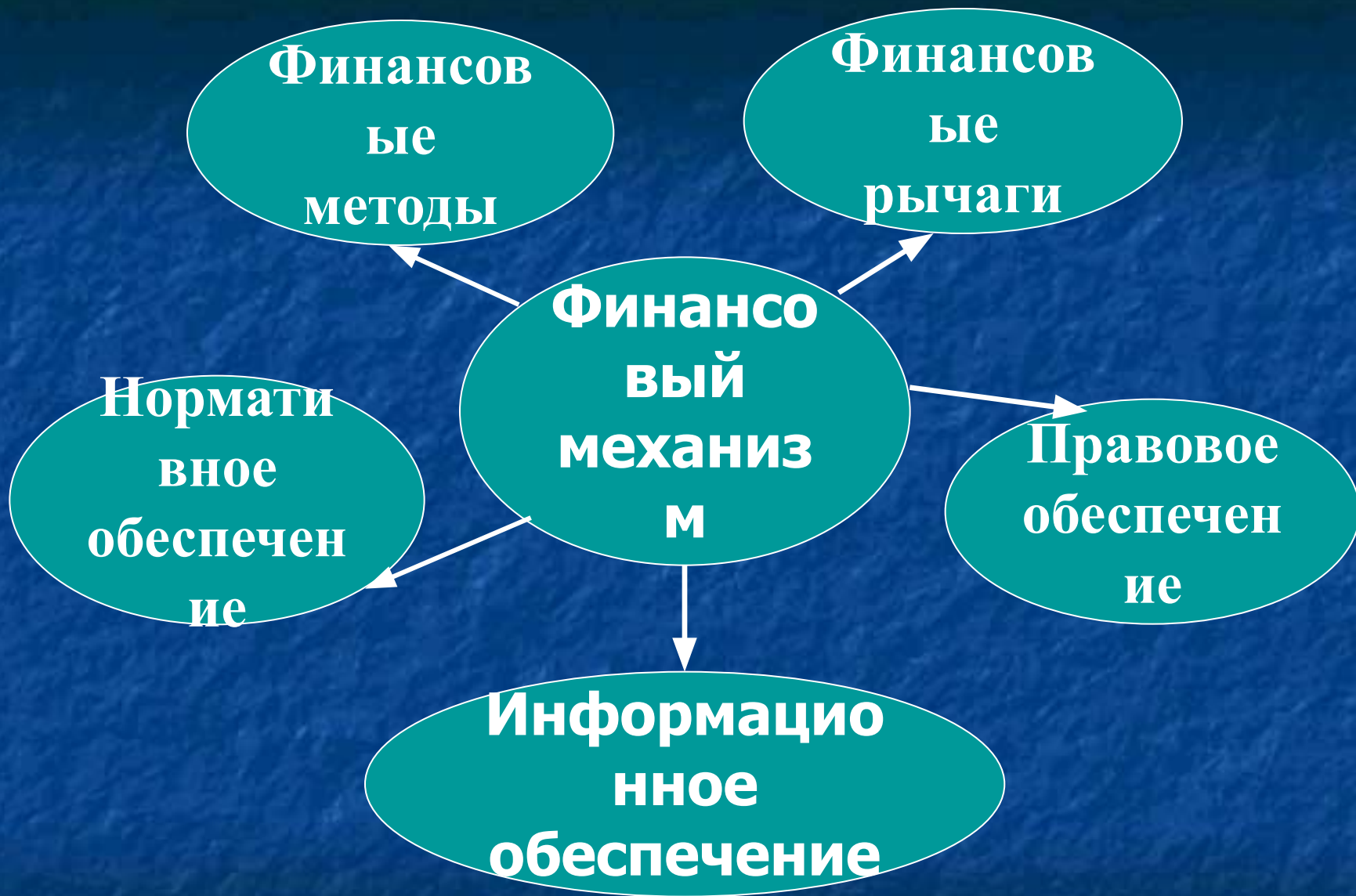
Рисунок 2 - Структура финансового механизма