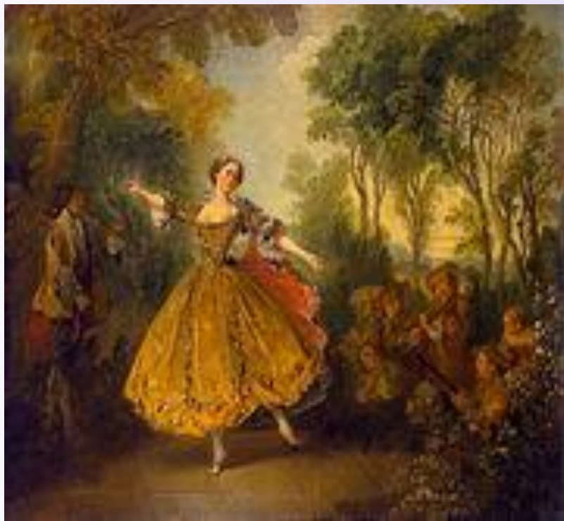
Мари Анн Камарго.