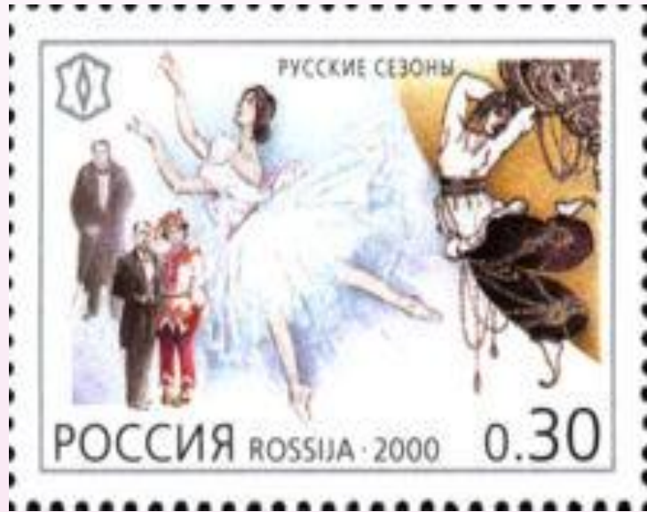
Марка России 2000года. Сергей Дягилев и Русские сезоны.