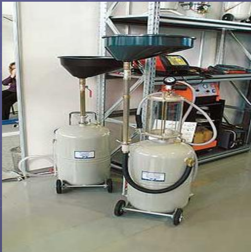
Нагнетатель автомобильных масел