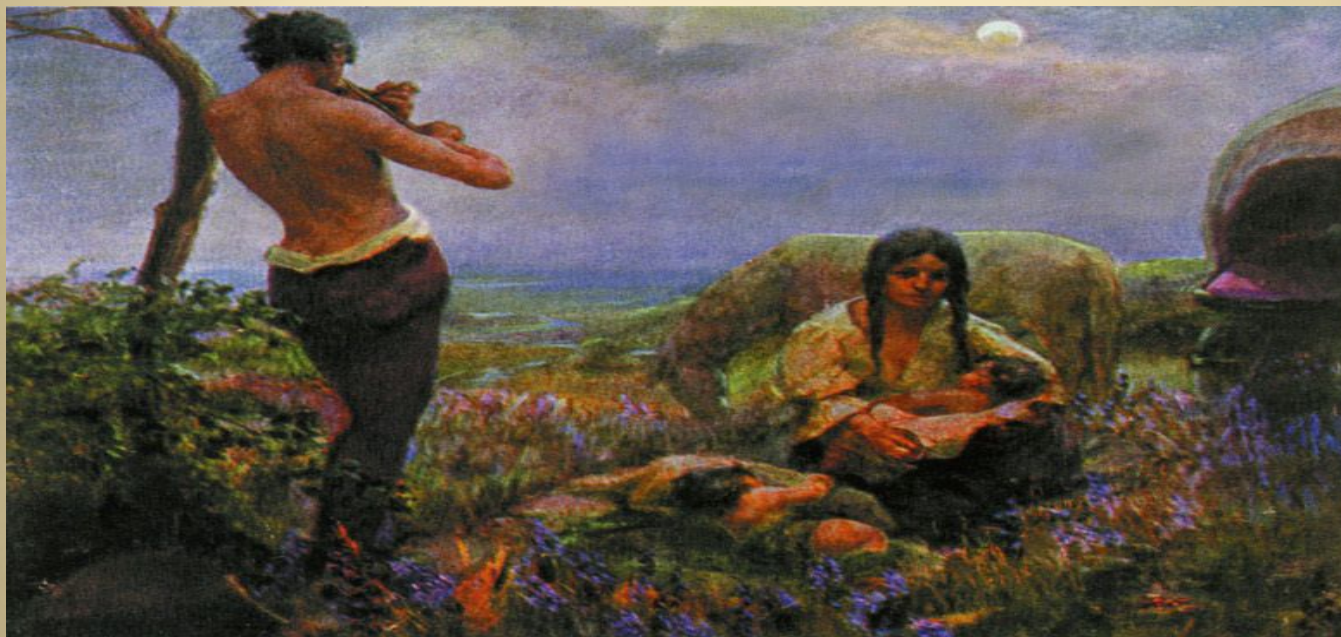
Неизвестный художник Около 1910 года.

Цыган из неизвестной семьи или утративший сведения о своей семье считается «безродным», вес в обществе его очень низок, к нему проявляют уважение только в пределах норм вежливости