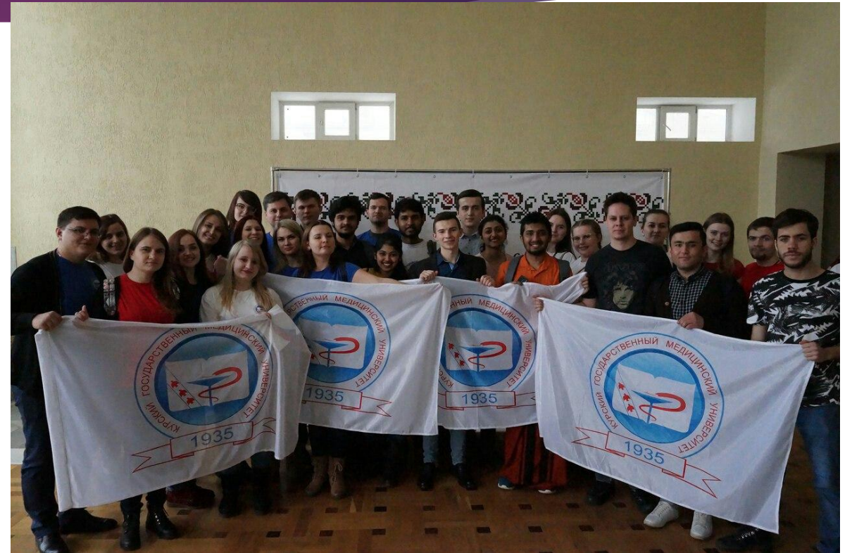
Молдавский праздник «МЭРЦИШОР»