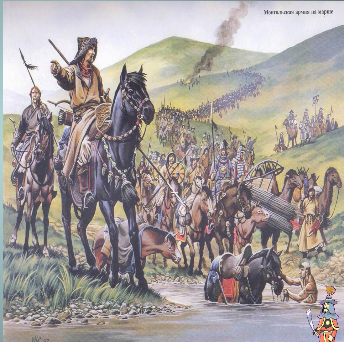
Монгольская армия на марше

1206г. – образование МОНГОЛЬСКОГО военно- кочевого государства, ориентирован ного на агрессию и захват чужих территорий, во главе с Темучжином (Чингисханом)