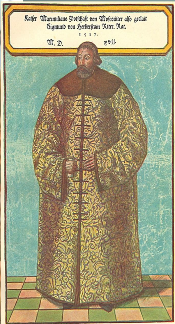
Сигизмунд Герберштейн, «Записки о Московии»