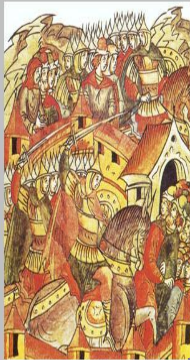
Захват Москвы ханом Батыем. Миниатюра из Лицевого летописного свода XVI в.

Несколько дней продолжались убийства. Наконец исчез вопль отчаяния: ибо уже некому было стенать и плакать