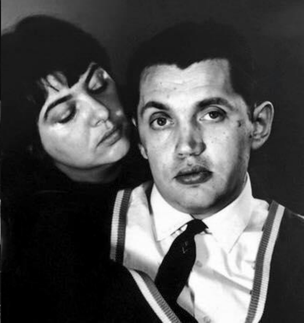
Алла Киреева и Роберт Рождественский