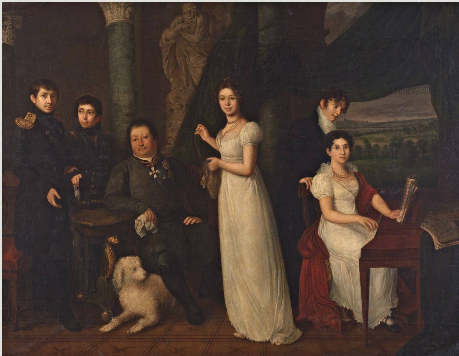
В. А. Тропинин. "Семейный портрет графов Морковых", 1813 г.