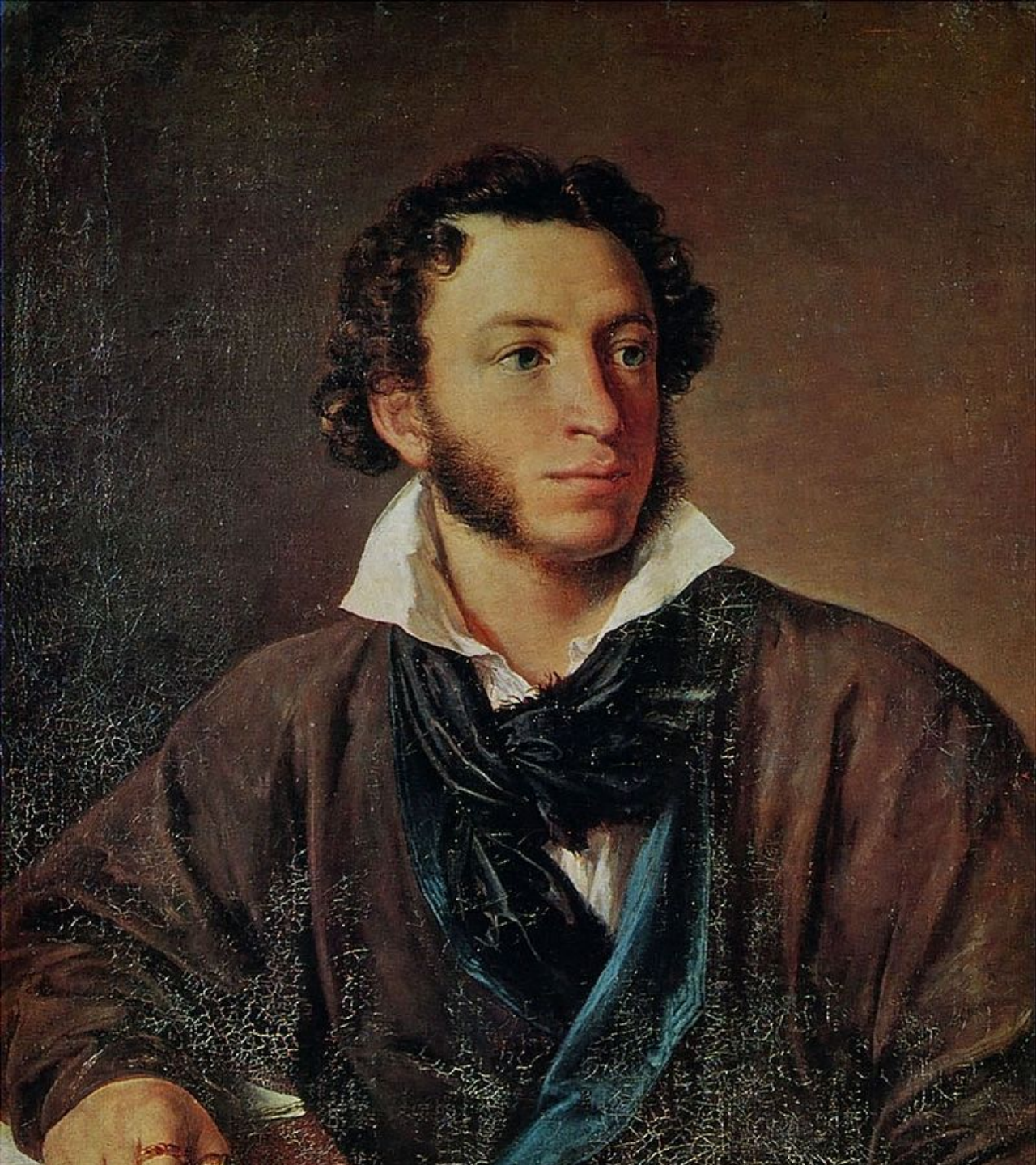
Портрет А. С. Пушкина. 1827.