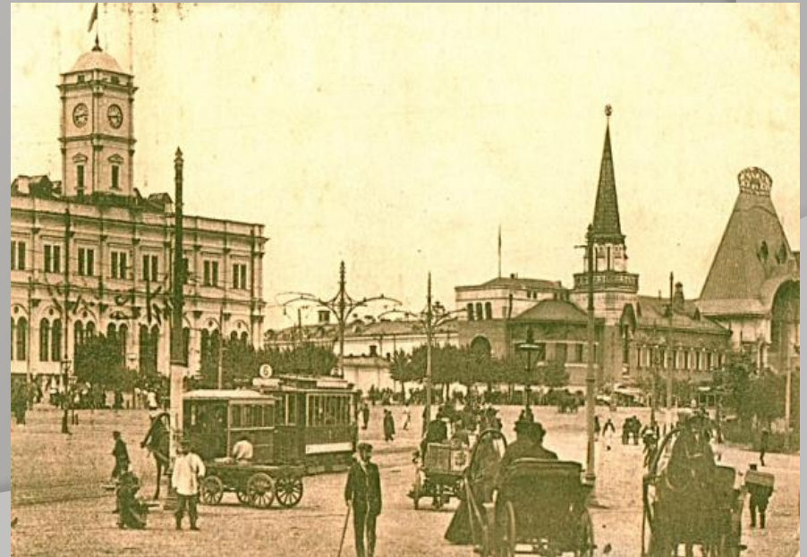
Москва 20-х годов.