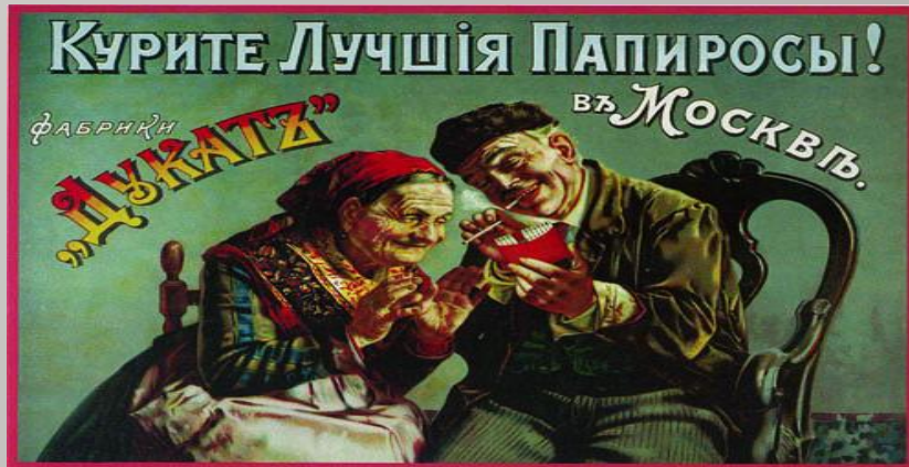
Реклама 20-х годов.

Они были лишены избирательных прав, не могли вступать в профсоюзы, но в то же время обладали высокими доходами.