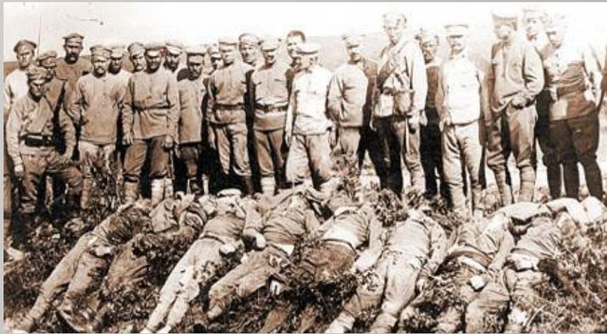
Хоронят жертв голода в Поволжье

Почему современники называли крестьянские бунты «малой гражданской войной»?