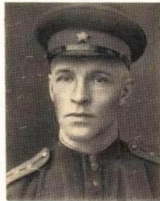
М. А. Максимов, военный корреспондент, автор фронтового варианта «Синего платочка».