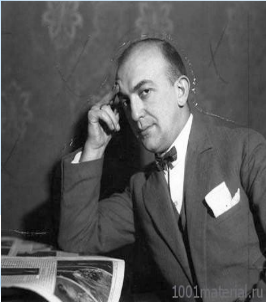
Композитор - Ежи Петербургский

Синенький скромный платочек Падал с опущенных плеч. Ты говорила, что не забудешь Ласковых, радостных встреч. Порой ночной Мы распрощались с тобой... Нет больше ночек. Где ты, платочек, Милый, желанный, родной?