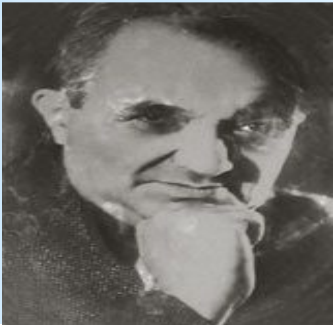
Поэт - Владимир Агатов

Как я люблю глубину твоих ласковых глаз, Как я хочу к ним прижаться сейчас губами! Темная ночь разделяет, любимая, нас, И тревожная, черная степь пролегла между нами.