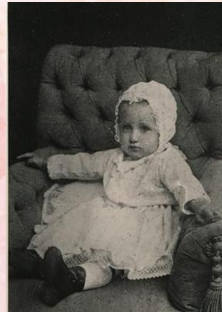
А. Ахматова в детстве