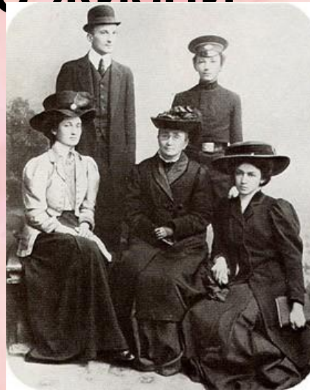
Семья Горенко. Анна, Инна Эразмовна, Ия, Андрей и Виктор. Киев. 1909 год

Ахматова Анна Андреевна (настоящая фамилия — Горенко) родилась в семье морского инженера, капитана 2-го ранга в отставке на ст. Большой Фонтан под Одессой. Через год после рождения дочери семья переехала в Царское Село. Здесь Ахматова стала ученицей Мариинской гимназии, но каждое лето проводила под Севастополем. В 1905 г. после развода родителей Ахматова с матерью переехала в Евпаторию. В 1906 — 1907 гг. она училась в выпускном классе Киево-Фундуклеевской гимназии, в 1908 — 1910 гг. — на юридическом отделении Киевских высших женских курсов.