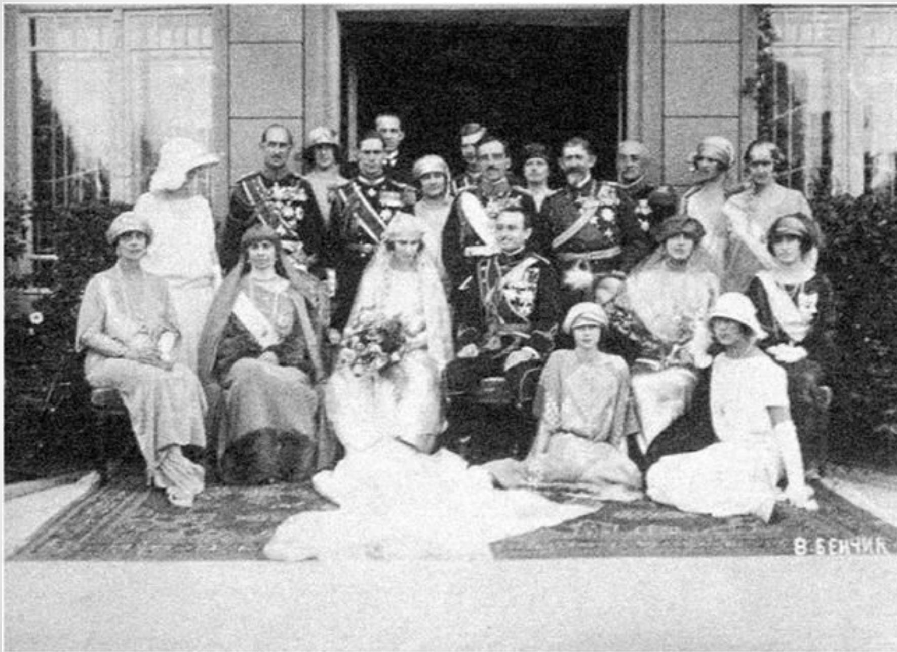
Король Александр з членами королівської родини