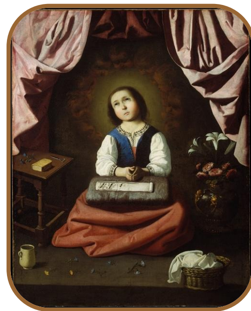
Франсиско Сурбаран Детство Марии

Иоаким и Анна, исполнив свои обет, возвратились домой, а Мария осталась жить при храме. Там она вместе с другими девочками обучалась Закону Божию и рукоделию; много молилась, читала Священное Писание и строго соблюдала пост.