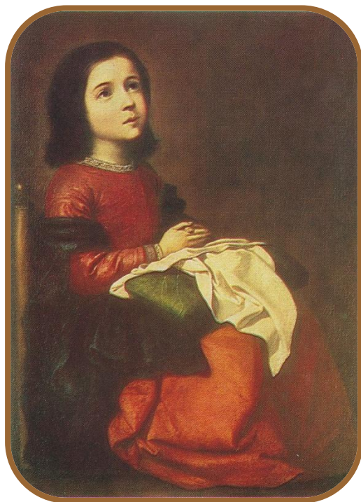
Франсиско Сурбаран Отрочество Мадонны

Иоаким и Анна, исполнив свои обет, возвратились домой, а Мария осталась жить при храме. Там она вместе с другими девочками обучалась Закону Божию и рукоделию; много молилась, читала Священное Писание и строго соблюдала пост.