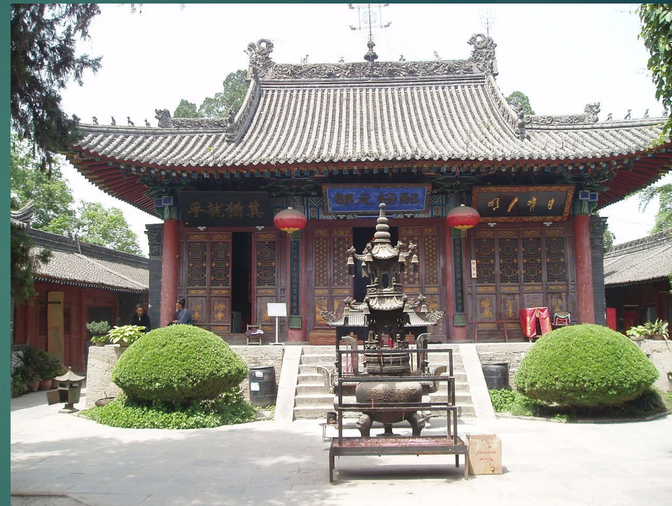
Павильон в Лоугуаньтае.