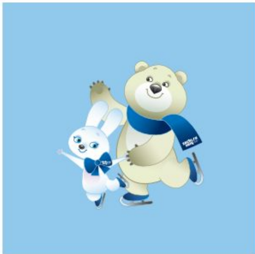
Figure skating Фигурное катание

Где проходила предыдущая зимняя олимпиада?