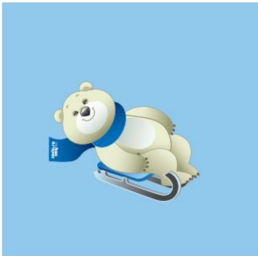
Luge Санний спорт

Какие по счету зимние Олимпийские игры пройдут в Сочи в 2014 году?