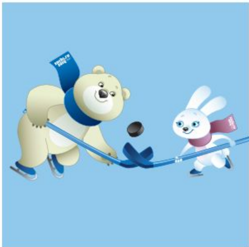
Ice-Hockey Хоккей на льду

Сколько олимпийских зимних видов спорта и дисциплин сегодня существует?