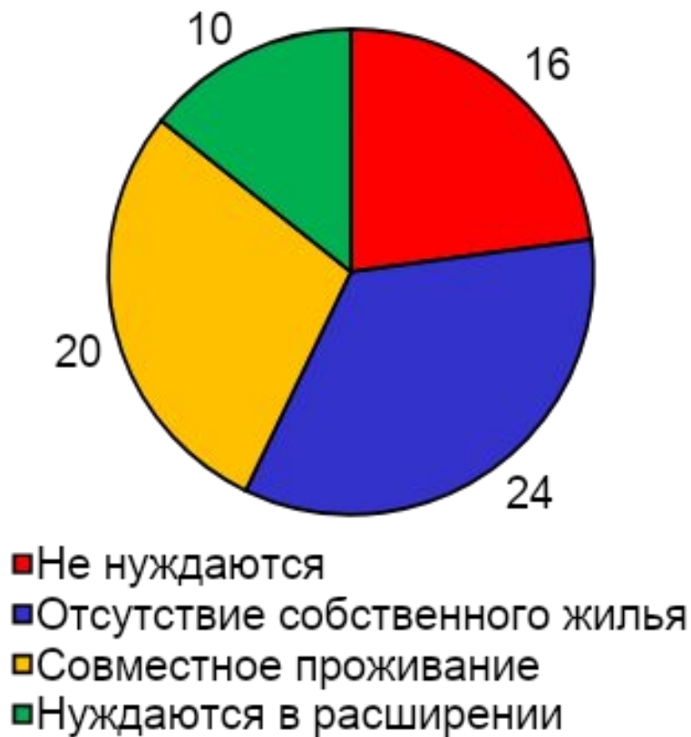
Потребность в ипотечном кредитовании