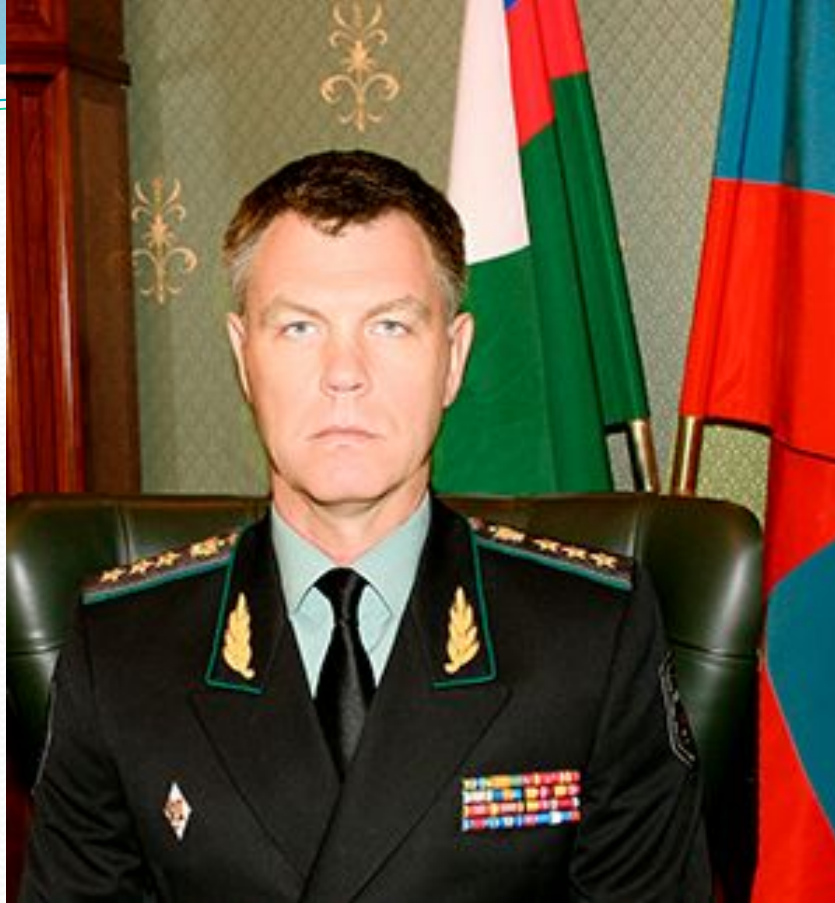
Директор Федеральной службы судебных приставов – главный судебный пристав РФ – Аристов Дмитрий Васильевич Действительный государственный советник РФ 1 класса, полковник запаса