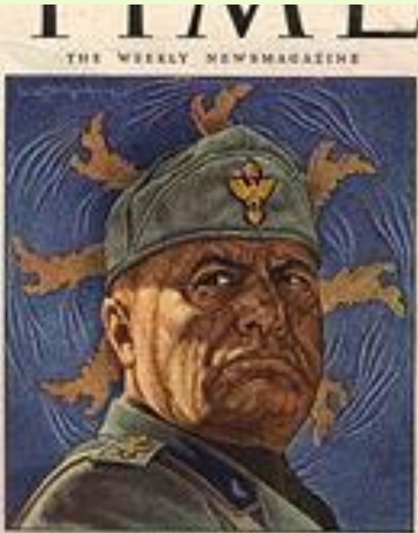
MUSSOLINI The Man to Watch