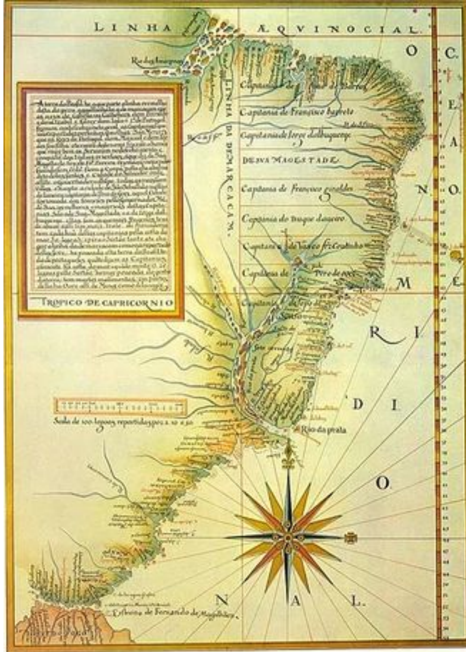
Карта колониальной Бразилии, на которой отмечены границы первых 14 капитанств

К началу XVII века колониальная система Португалии испытывала кризис, которым поспешили воспользоваться ее соседи, стремившиеся захватить как можно больше территорий в Америке