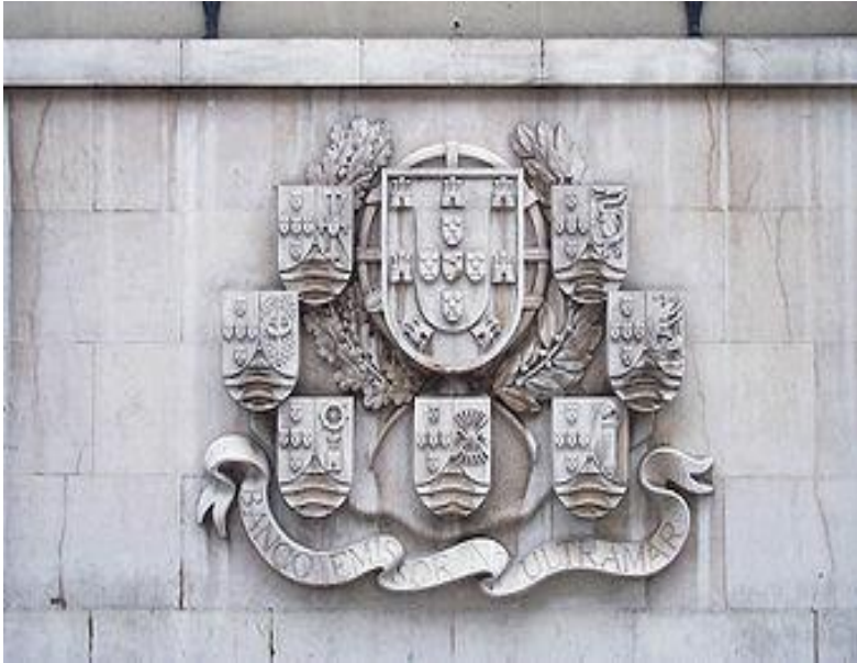
Герб Португалии в окружении гербов колоний

Великие географические открытия конца XV века, активная деятельность португальской знати и торговых элит привели к созданию крупнейшей морской империи нескольких следующих веков.