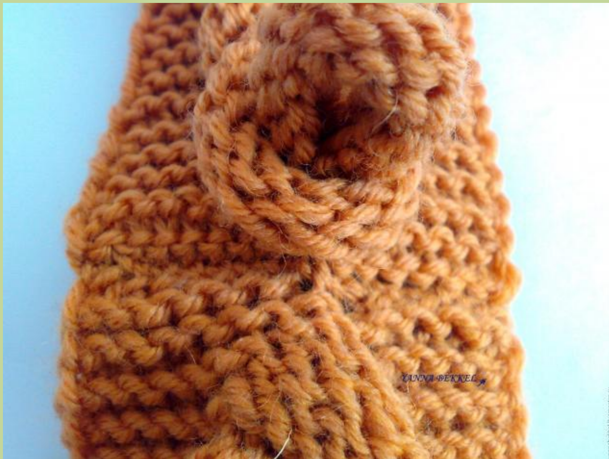
Вид связанных концов со стороны косы.