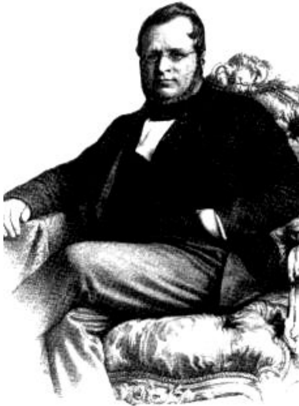
Граф Кавур. Гравюра 2- пол.19 в.