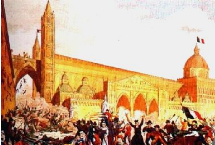
Восстание в Палермо.