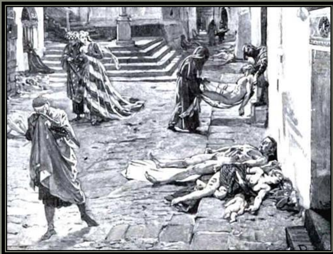
Эпидемия чумы в Италии 1348 год

На возникновение и течение эпидемии влияют как процессы, протекающие в природных условиях (природная очаговость, эпизоотии и т. д.), так и социальные факторы (коммунальное благоустройство, бытовые условия, состояние здравоохранения и т. д.).