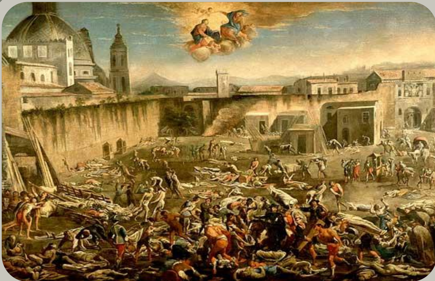
КАРТИНА «ЧУМА В НЕАПОЛЕ В 1656» (Музей Сан-Мартино, Неаполь.)

Эпидемия - это массовое, прогрессирующее во времени и пространстве в пределах определенного региона распространение инфекционной болезни людей, значительно превышающее обычно регистрируемый на данной территории уровень заболеваемости.