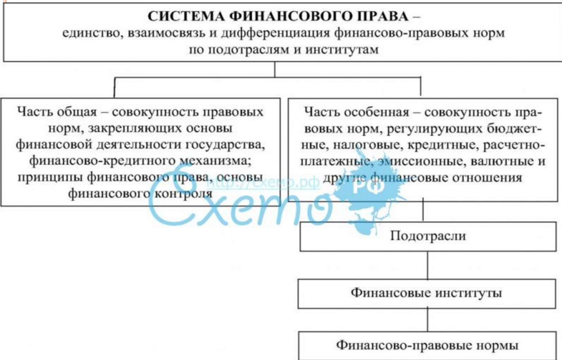
Схема 16. Система финансового права