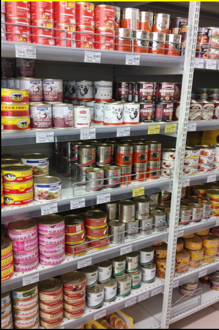
Фото каждого наименования

Общая фотография полки . От 3 до 10 фото, так чтобы была представлена вся ситуация в ПТ