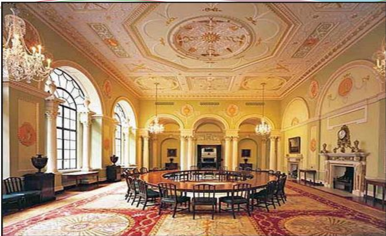
Внутренний интерьер Банка Англии