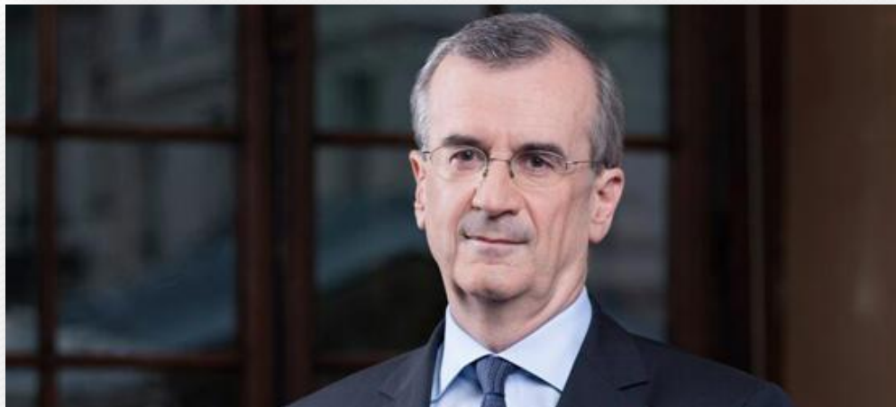
Франсуа Виллеруа де Гало