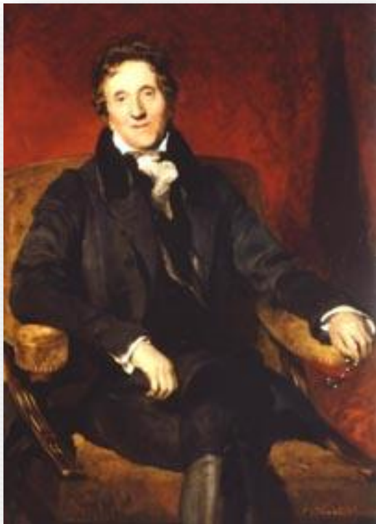
Джон Сноун- архитектор Банка Англии