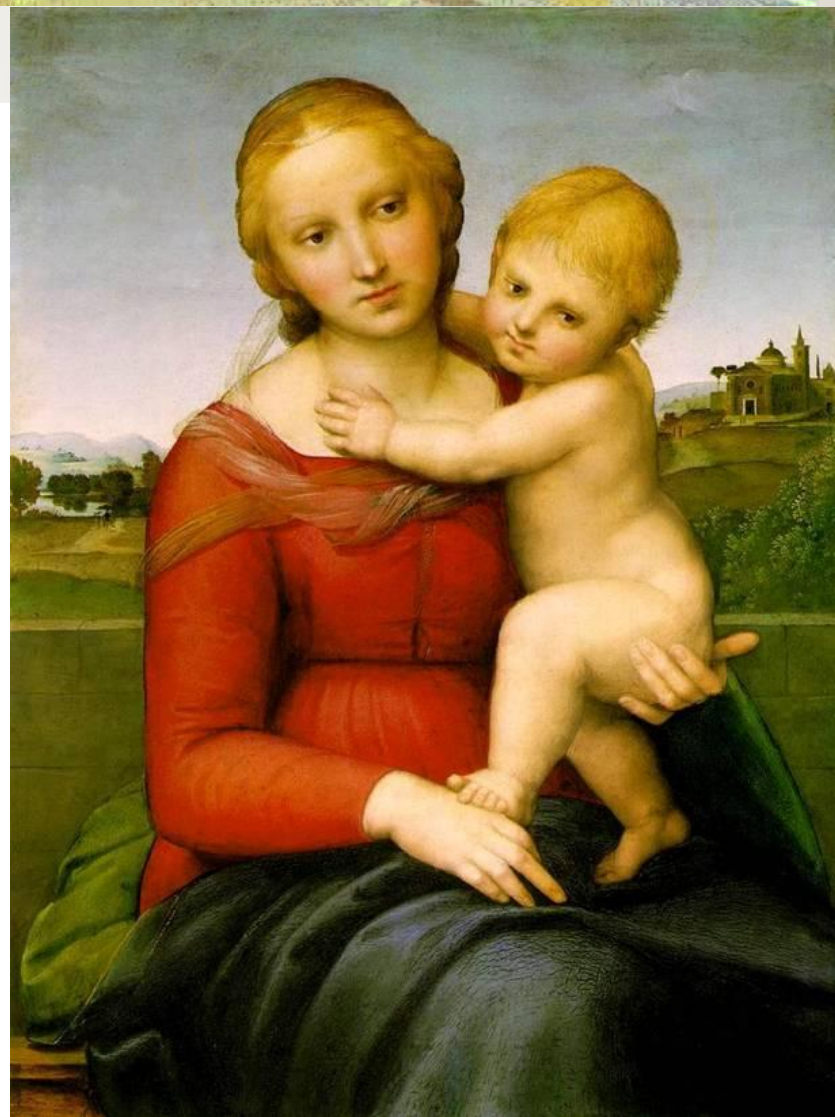
Рафаэлло Санти ( 1483-1520) Малая Мадонна Каупер 1505г.