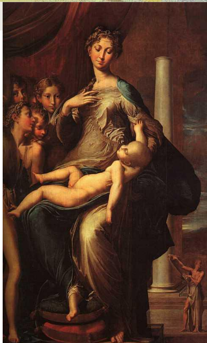
Пармиджанино (Mazzola) (1503-1540) Мадонна с длинной шеей 1534г.