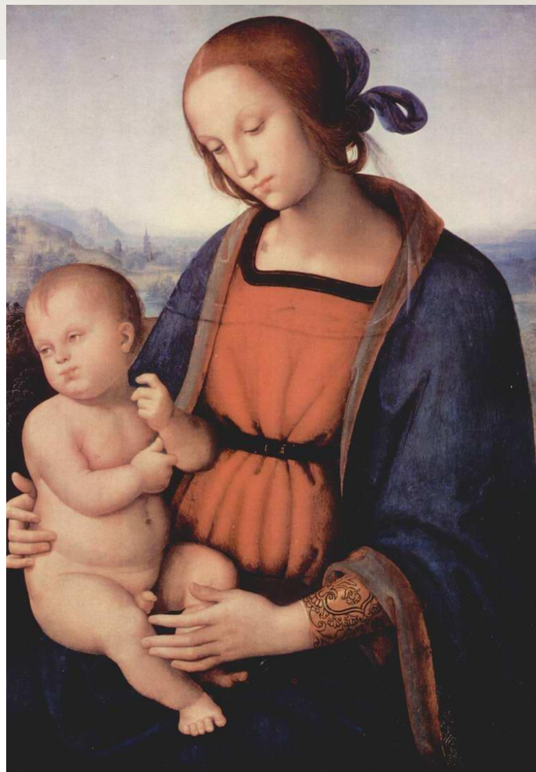
Пьетро Перуджино (Perugino) (1450-1523) Мадонна 1496г.