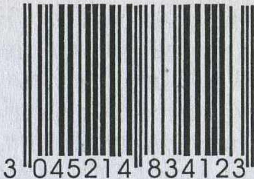
Рис. 3.5. 13-разрядный штриховой код EAN