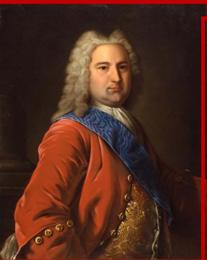
Эрнст Бирон – фаворит Анны Иоанновны