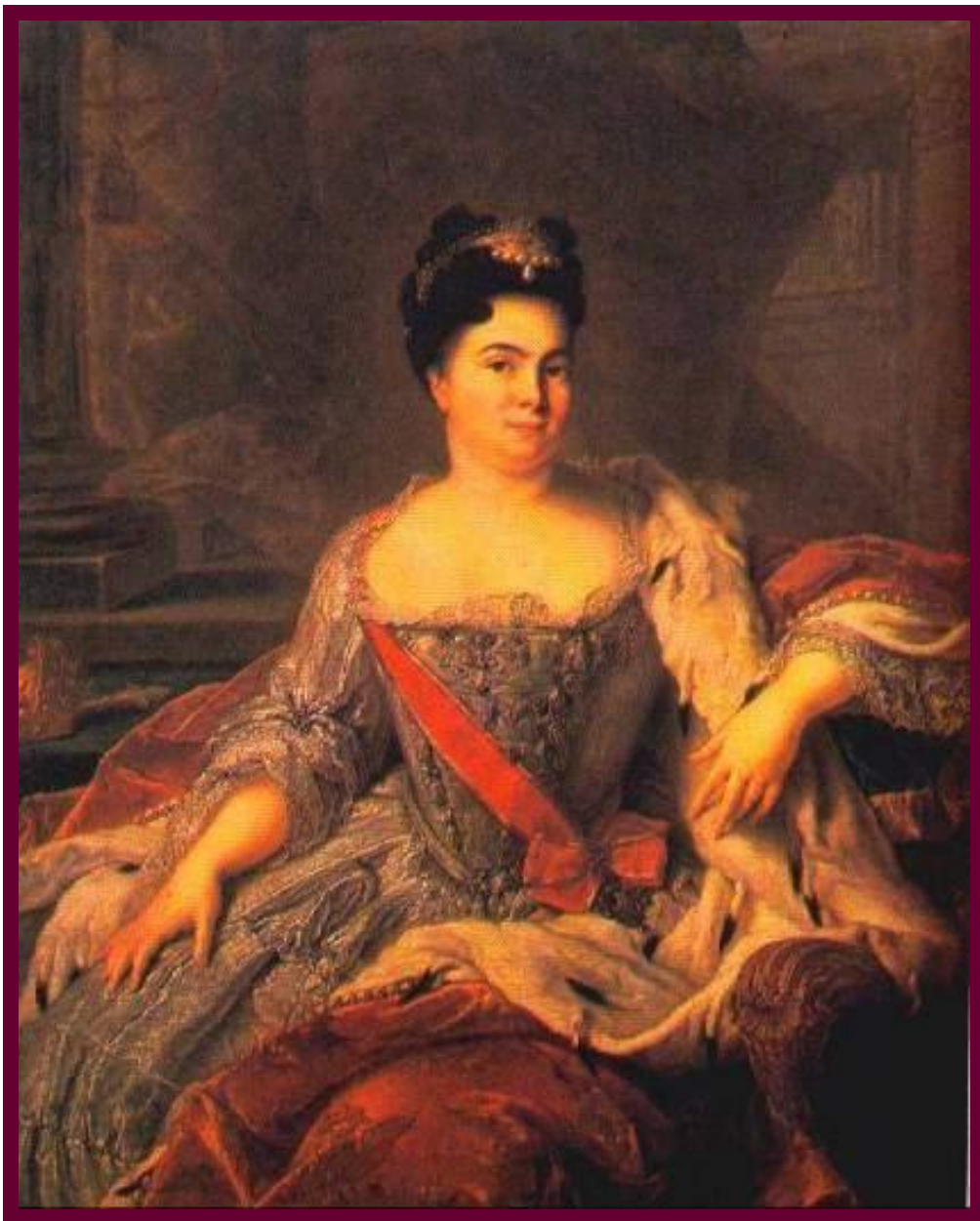
Екатерина I (1725 -1727 гг.)