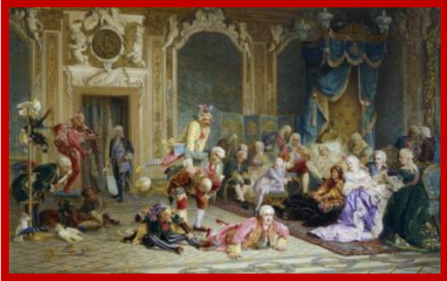
Якоби Валерий Иванович. Шуты при дворе императрицы Анны Иоанновны.

1730-1740 гг. - правление Анны Иоанновны Племянница Петра I, вышедшая замуж за герцога Курляндского, прозвище «Кровавая», «Митавская затворница».