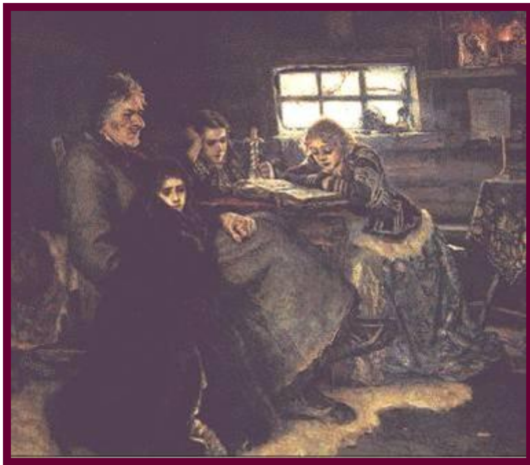
Суриков В.И. Меншиков в Березове.

Меншиков был смещен со всех постов, лишен всего состояния и сослан в Сибирь. Огромное влияние на Петра оказывали Долгорукие и Голицыны, но и их постигла неудача. В январе 1730 г. Петр заболел и умер