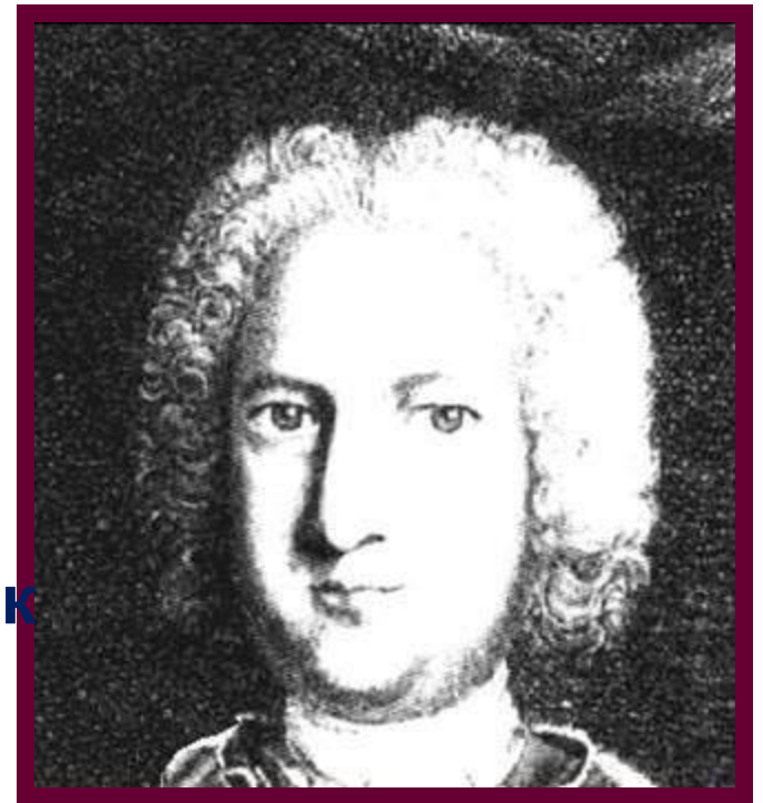
Эрнст Иоганн Бирон

Всюду свирепствовала тайная полиция, выносились смертные приговоры.