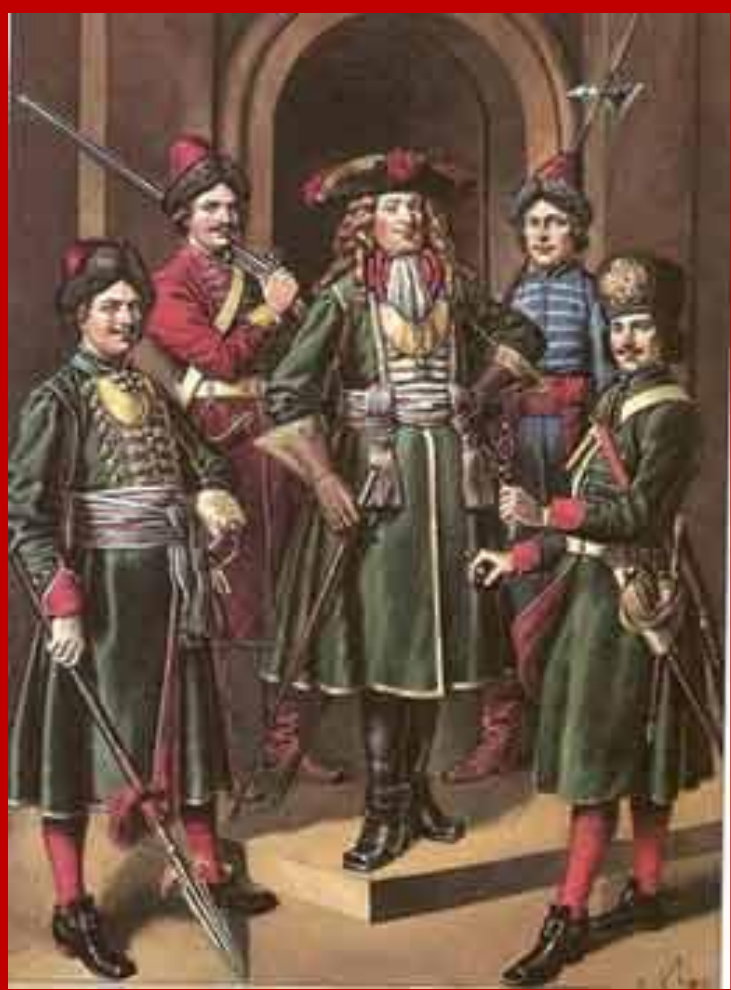
С. Летин "Служилое платье от Петра Великого. Гвардейские мундиры"