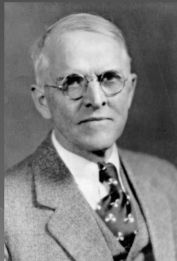
Уэсли Митчелл (1874–1948).