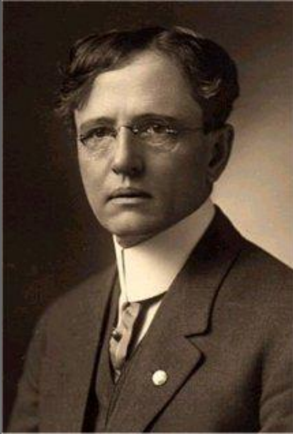
Джон Коммонс (1862–1945)