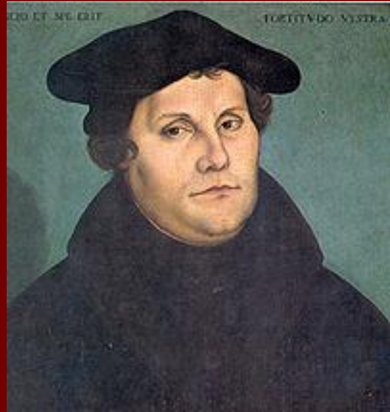
Портрет 1533 г. Худ. Л.Кранах Ст.