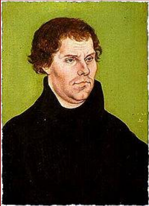
Портрет 1526 г. Худ. Л.Кранах Ст.