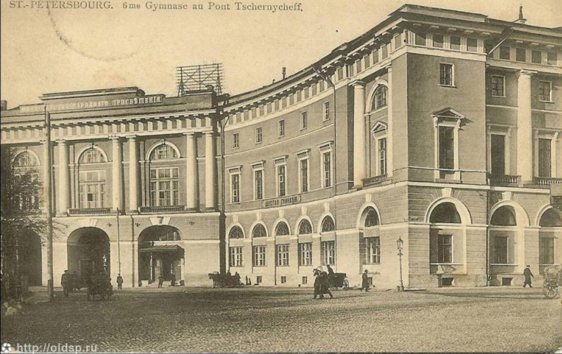
С. ПЕТЕРБУРГ. Шестая гимназия у Чернышева моста. ST.-PETERSBOURG. 6me Gymnase au Pont Tschernycheff.