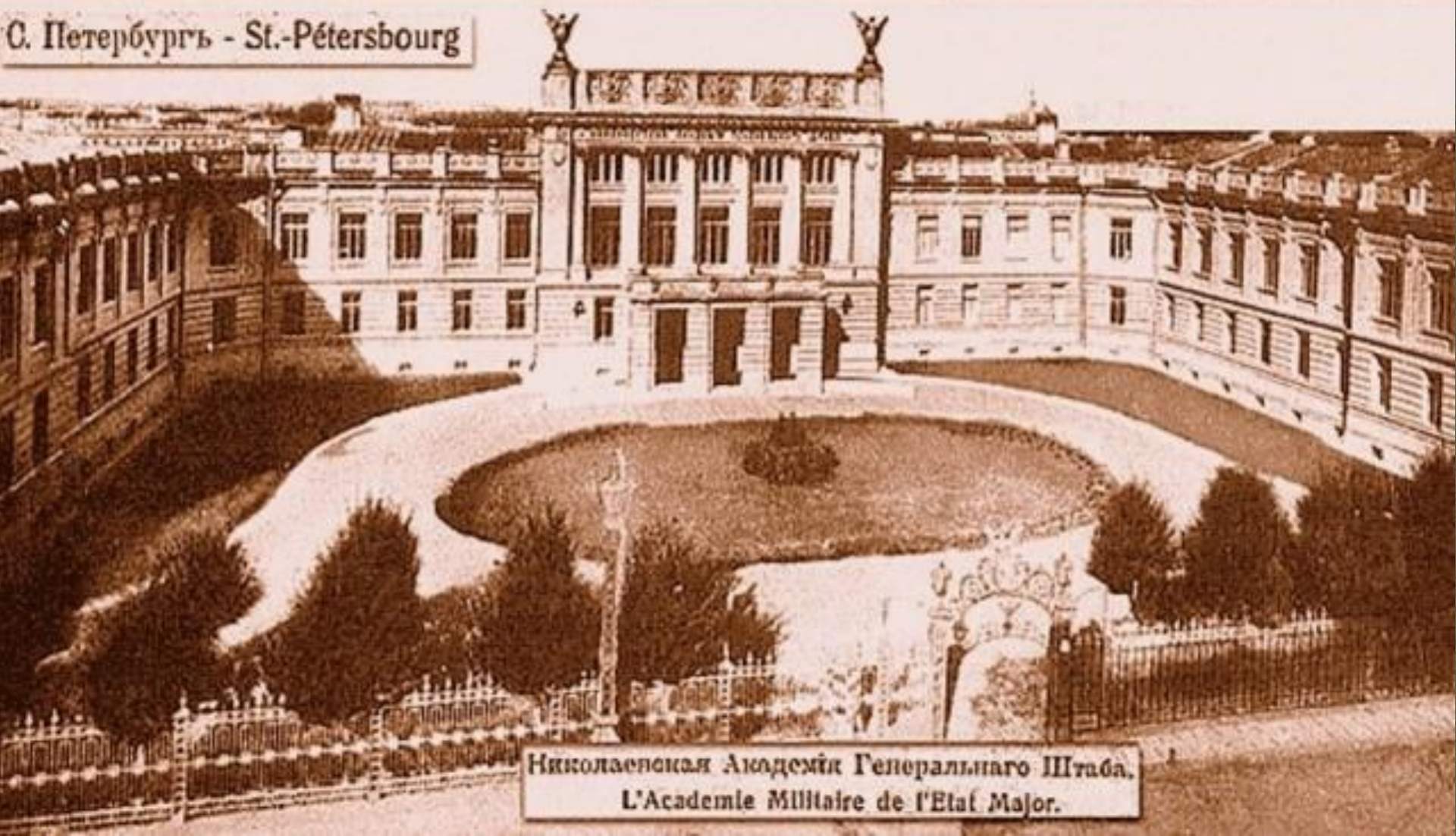
Николаевская Академія Генеральнаго Штаба. L'Academie Militaire de l'Etat Major.