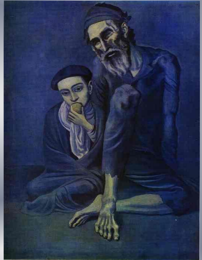
Нищий старик и мальчик