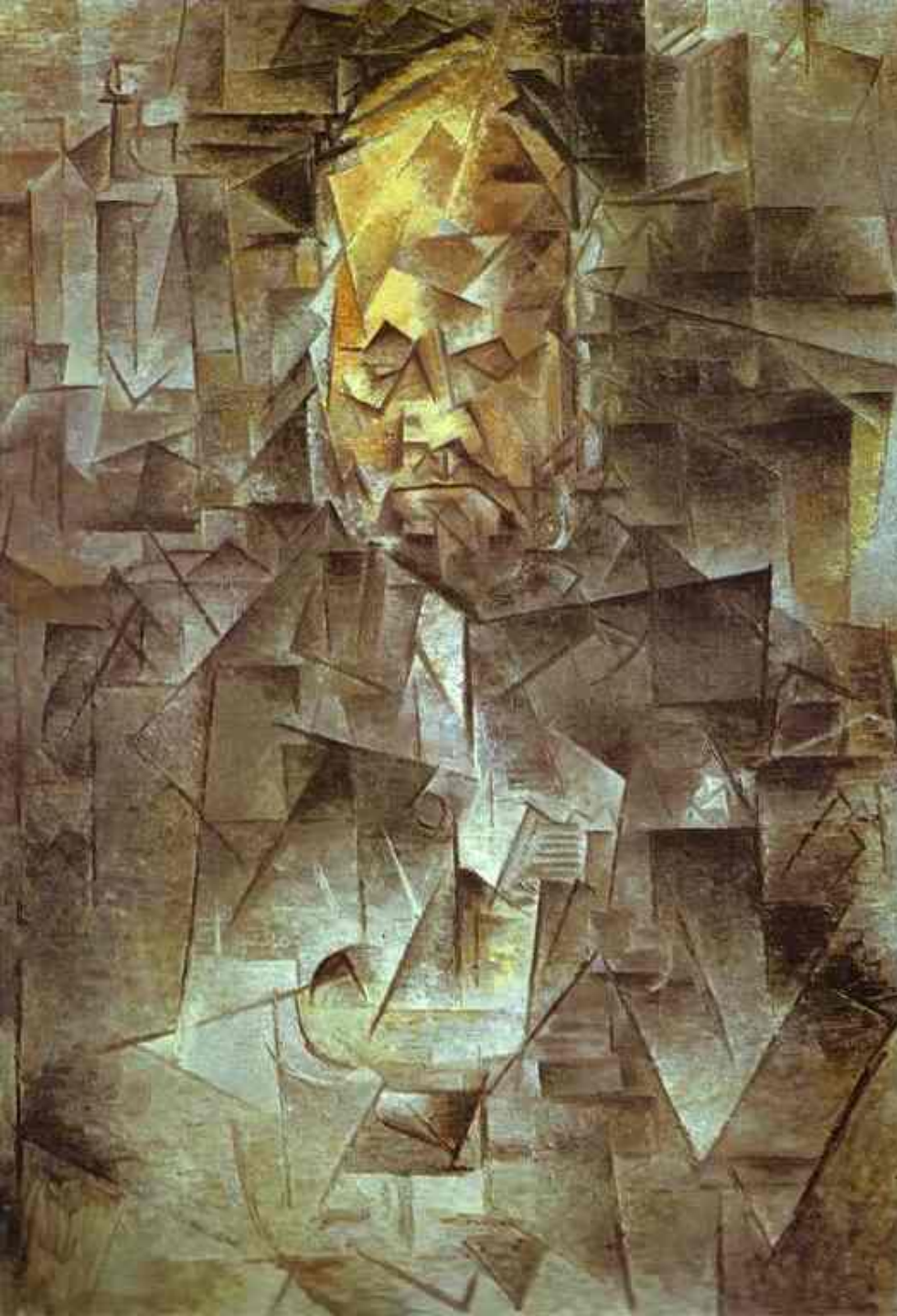
Портрет Амбруаза Воллара