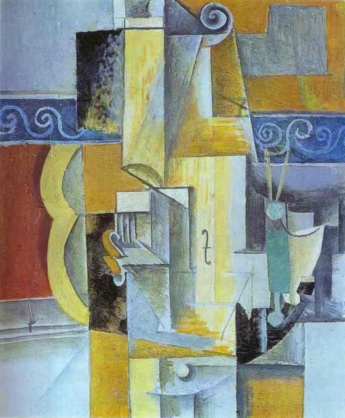
Скрипка и Гитара