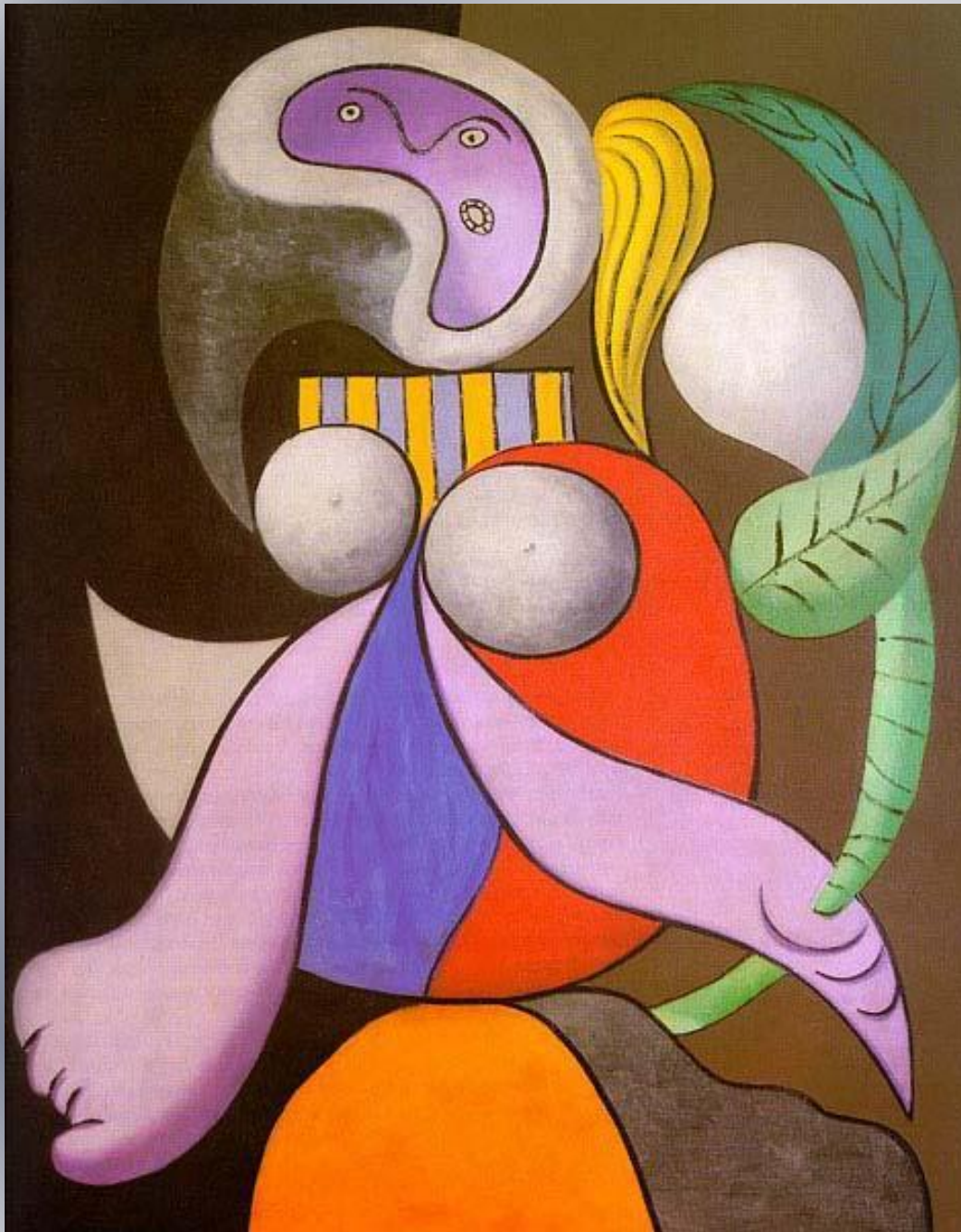
Женщина с цветком