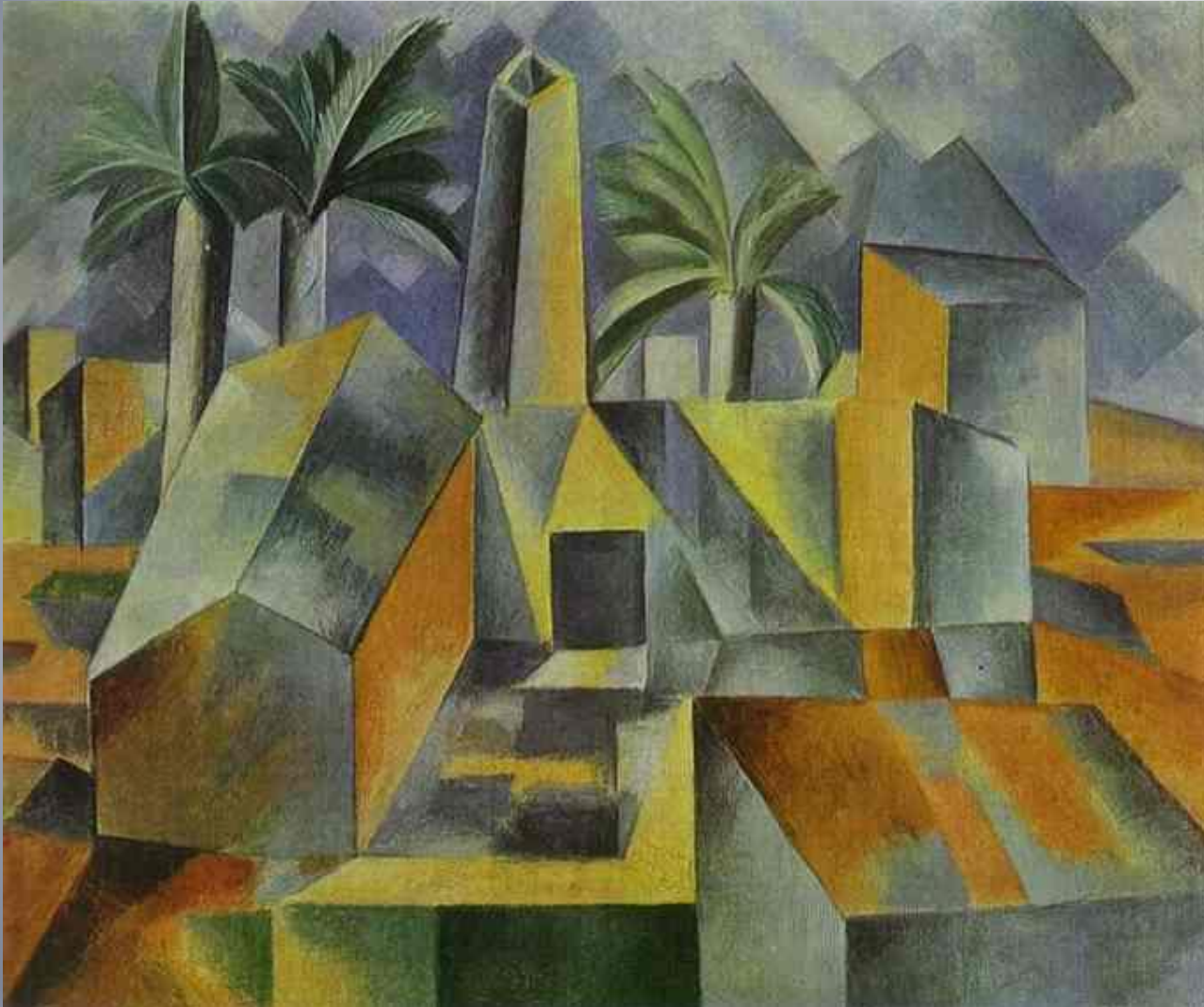
Завод в Хорта де Сан