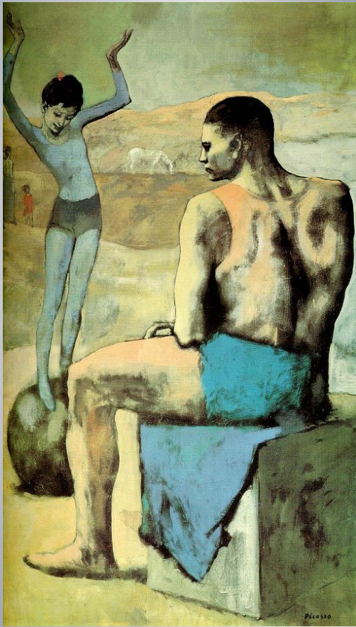
Девочка на шаре