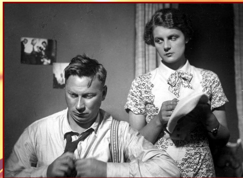
«Профессор Мамлок» 1938 г.