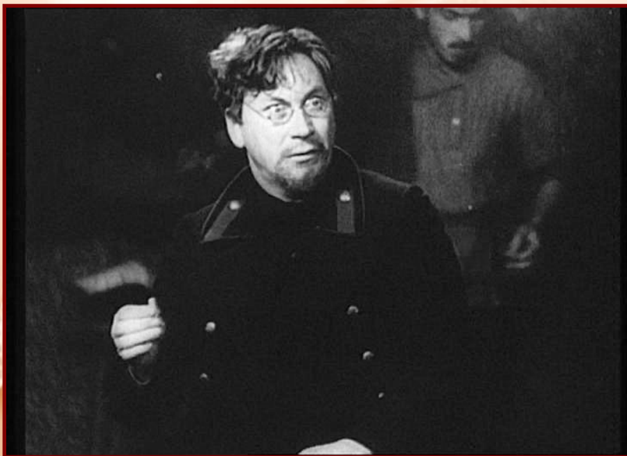
Возвращение Максима 1937 г.