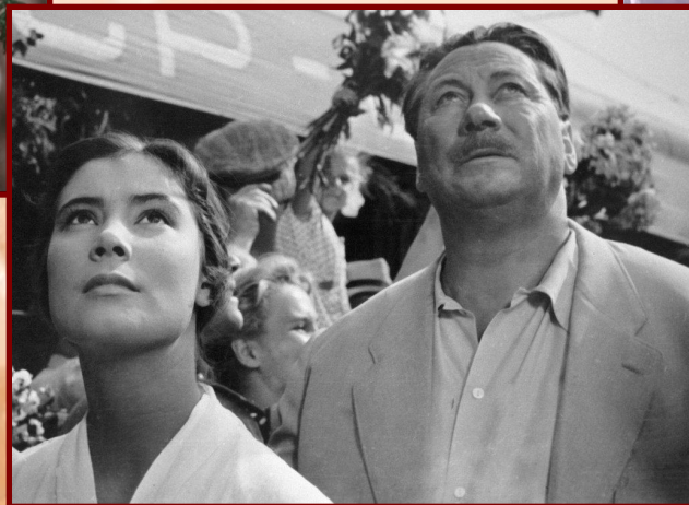
«Летят журавли» 1957 г.