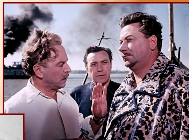
«Верные друзья» 1954 г.