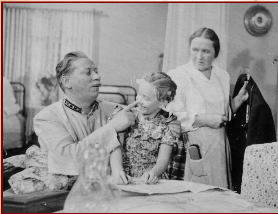
«Донецкие шахтеры» 1952 г.

Вскоре пришло признание и официальных властей. Сталинские премии. Одна за другой. За роль Ульяныча в историко-биографическом фильме «Глинка» (1947). За роль Степана Ивановича в фильме « Повесть о настоящем человеке » (1949). За роль Горового в фильме « Донецкие шахтеры » (1952).