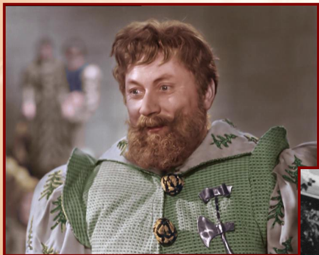
«Золушка» 1947 г.»

Зрителям же больше нравились другие роли Меркурьева. Добрый лесничий в незабываемой сказке «Золушка» , академик-архитектор Нестратов в лирической комедии «Верные друзья» , Мальволио в экранизации шекспировской «Двенадцатой ночи» , Федор Иванович в драме «Летят журавли» ... Время все расставило по своим местам. Выбор зрителей оказался верным, - эти картины пользуются успехом и сегодня.