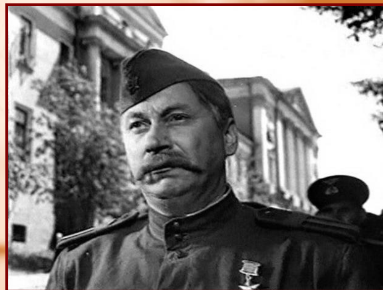
«Повесть о настоящем человеке» 1949 г.