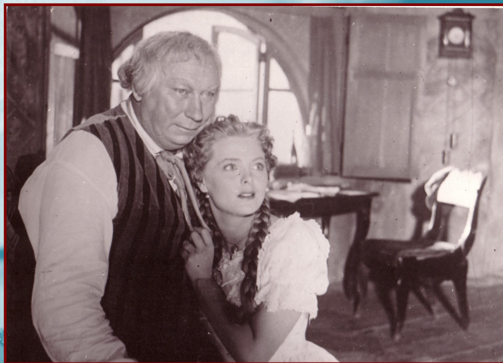
«Лев Гурыч Синичкин» 1956 г.

«Папа приезжал не как гастролер: сразу раз - и впрыгнул в спектакль! Нет. Он приезжал за неделю, репетировал, входил в ансамбль, а потом шли колоссальные триумфы.