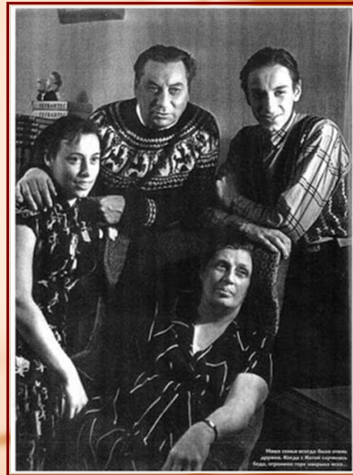
Василий Васильевич, Ирина Всеволодовна и их дети – Екатерина и Петр. 1962 год

Почти 12 лет она сидела дома. А когда Ирине Всеволодовне разрешили работать, она стала ставить спектакли в театре им. Пушкина, где работал Меркурьев. Вместе с ним вела актерскую мастерскую в театральном институте.