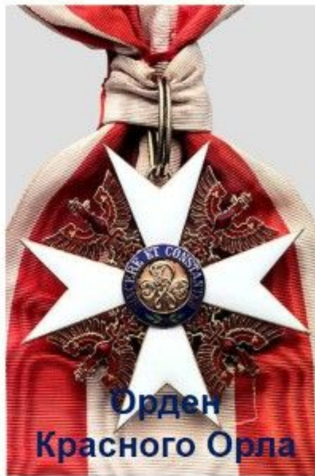
Орден Красного Орла