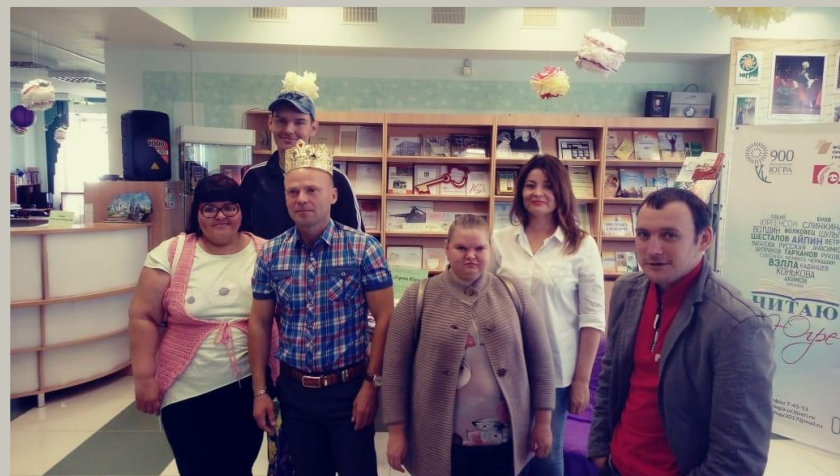
Центральная городская библиотека