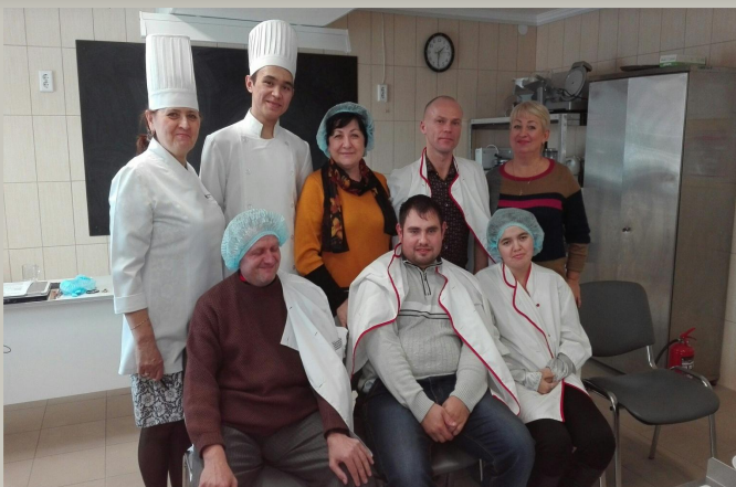
Советский политехнический колледж