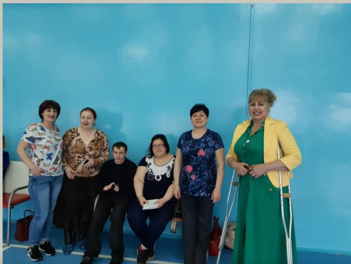
Центр адаптивного спорта