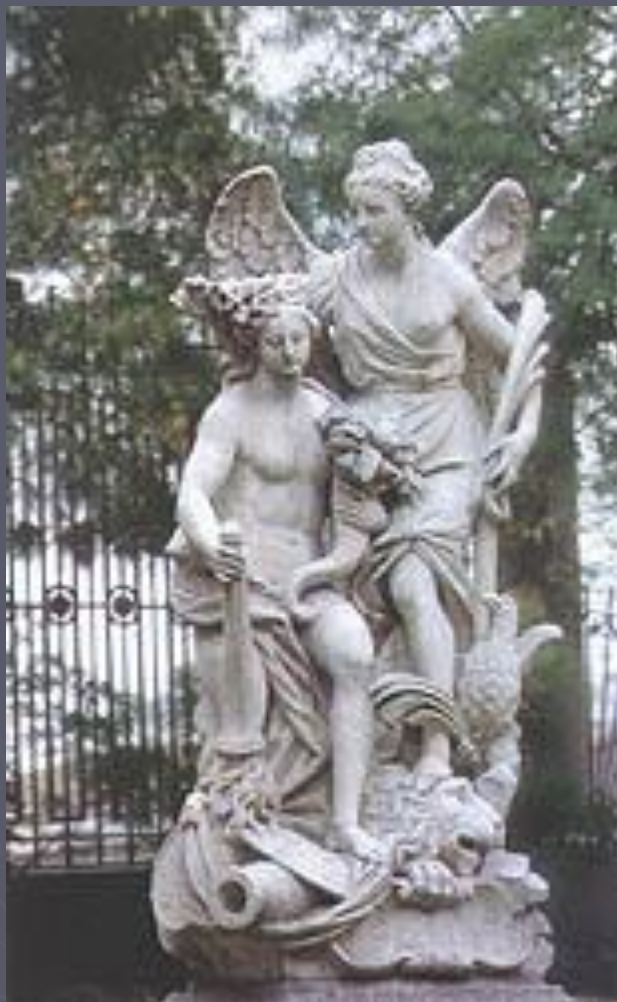
Группа "Мир и Изобилие" Мрамор Скульптор П. Баратта 1722 г.

Цветы высаживали на фигурных клумбах, которые образовывали орнаменты, похожие на ковровые узоры