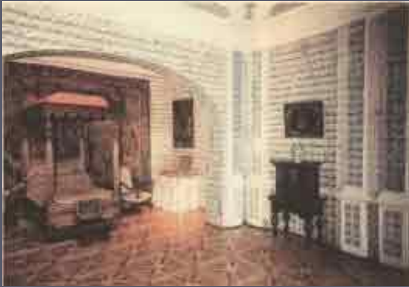
Дворец А. Д. Меншикова в Санкт-Петербурге Интерьер 1710—1727 гг .