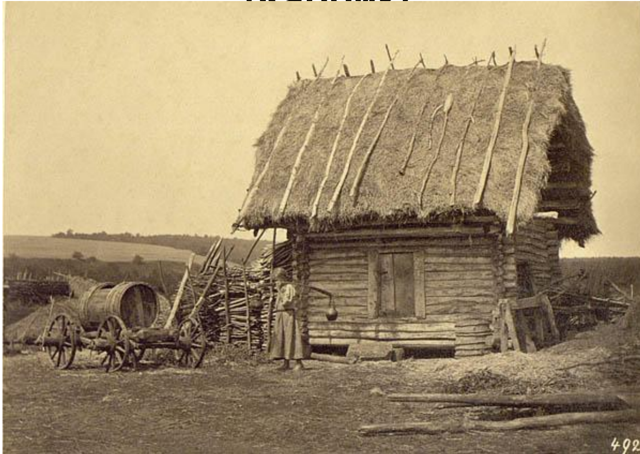
Крестьянские избы. Серия «Русские Симбирской губернии». 1860-е годы. Каррик. МАЭ РАН