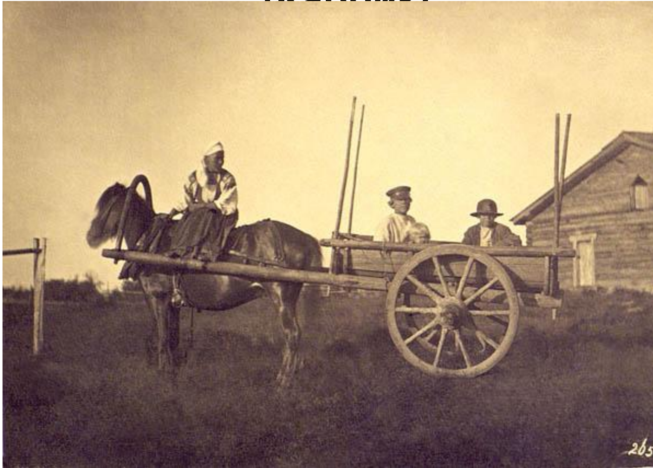
Финны. Серия «Финны Санкт-Петербургской губернии». 1860е годы. Каррик. МАЭ РАН