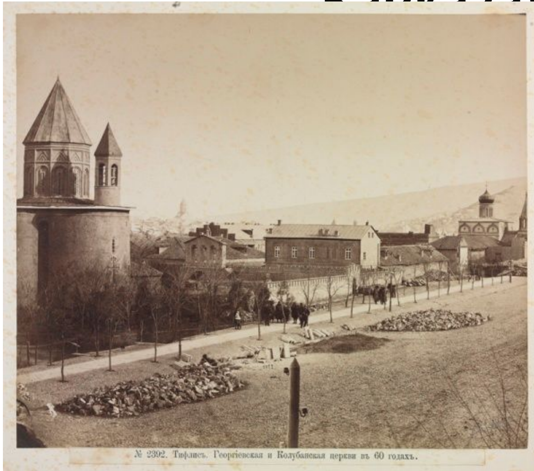
Тифлис. Георгиевская и Колубанская церкви в 1860-х годах.