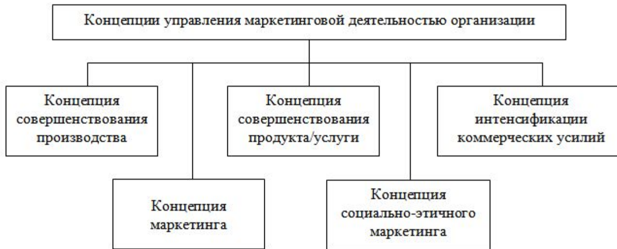
Рисунок 1 – Концепции управления маркетинговой деятельностью организации