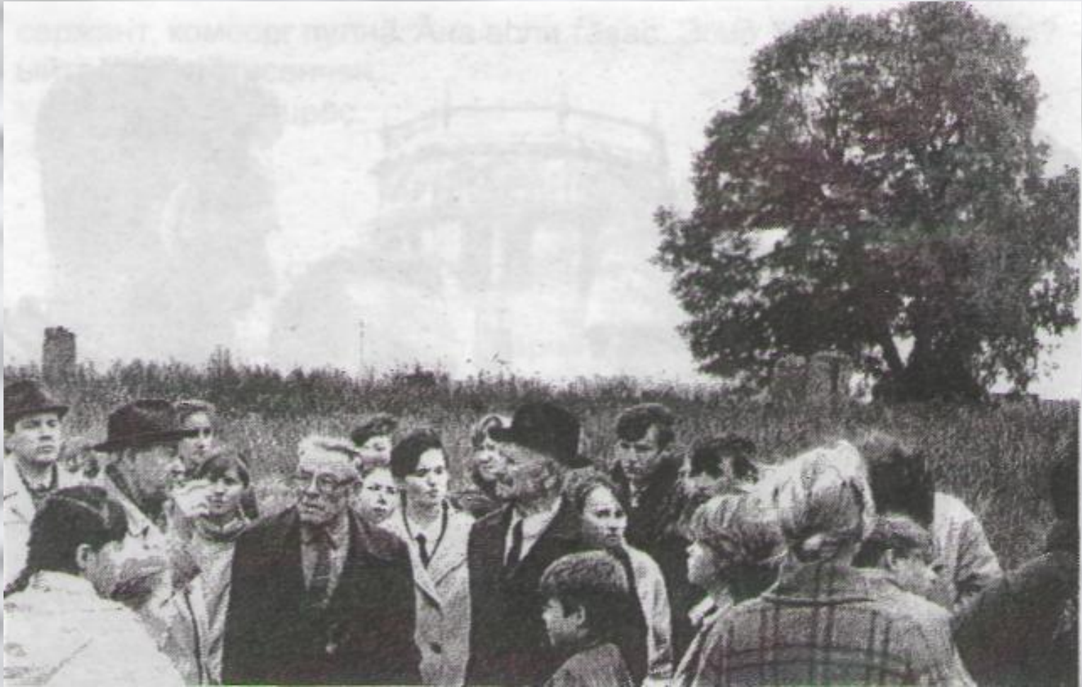
У деревни Богатырь, где погибла батарея И.А.Флерова. А.Захаров. 1988 г.