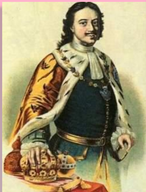
Петр I Великий